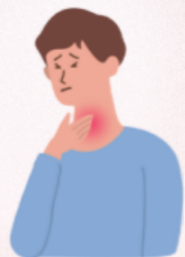
brongkitis problema sa bronchial