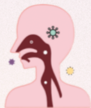
sakit sa lalamunan