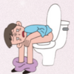
pamamaga ng bituka