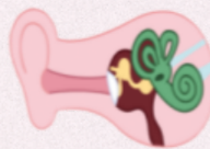
pamamaga sa gitnang taenga