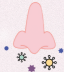
impeksyon sa sinus, ozena, sinusitis