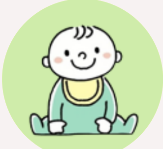
អត្តចរិតស្ងួត