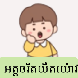
អត្តចរិតយឺតយ៉ាវ

ជោជោងឪពុកម្តាយសម្រេចចិត្តគ្រប់យ៉ាងសូមទុករឿងតូចតាចឱ្យកុមារសម្រេចដោយខ្លួនឯងហើយរឿងសំខាន់ៗសូមពិភាក្សាជាមួយកុមារសូមចែករំលែកកិច្ចព្រមព្រៀងនិងនិយាយពិភាក្សាជាមួយគ្នា។ ម៉ោក់ (ឬប៉ោ) គិតថា~ប៉ុន្តែOO(ឈ្មោះកូន) គិតយ៉ាងណាដែរ?"