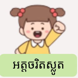
អត្តចរិតស្ងួត

សម្របខ្លួនបានល្អទៅនឹងស្ថានភាពថ្មីៗប៉ុន្តែអាចនឹងមិនបង្ហាញអារម្មណ៍មិនស្រួលរបស់ខ្លួនទេ។ សូមសួរថា "ថ្ងៃនេះយើងម៉េចដែរ?" ដើម្បីយល់ពីអារម្មណ៍របស់ក្មេងហើយបង្ហាញក្តីស្រឡាញ់និងការយកចិត្តទុកដាក់អោយបានច្រើន។