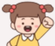
เด็กนิสัย พื้นฐานอารมณ์ค่อนข้างสงบ

แม่เด็กจะปรับตัวกับสถานการณ์ใหม่ได้ดี แต่อาจไม่แสดงความไม่สบายใจออกมา ลองถามว่า "วันนี้เป็นยังไงบ้าง?" เพื่อเข้าใจความรู้สึกของลูกและ แสดงความรักความเอาใจใส่ให้มากๆ