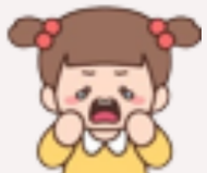
เด็กนิสัย พื้นฐานปรับอารมณ์ค่อนข้างยาก

แม่เวลาความต้องการไม่ได้ตั้งใจ ลูกอาจไม่ได้ผิดหวังมากนัก แต่เพื่อเสริมความเป็นตัวของตัวเองและการตัดสินใจ ควรตั้งข้อตกลงร่วมกันกับลูก