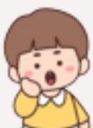
เด็กนิสัย พื้นฐานอารมณ์ที่ต้องใช้เวลา ในการปรับตัว

แทนที่จะให้พ่อแม่ตัดสินใจทุกอย่าง เรื่องเล็กๆ ควรให้ลูกเลือกเอง ส่วนเรื่องสำคัญให้ปรึกษากัน แคร่ข้อตกลงและพูดคุยร่วมกัน เช่น "แม่(พ่อ)คิด...แบบนี้ แล้วหนูคิดว่ายังไง?"